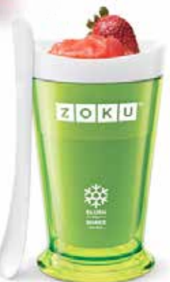
Slush&Shake Maker per granite Prezzo € 27,50