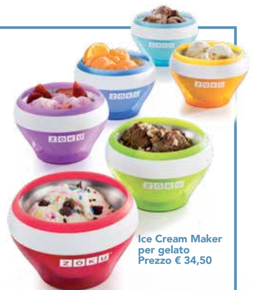
Ice Cream Maker per gelato Prezzo € 34,50