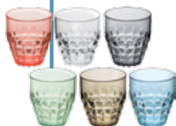
Set 6 bicchieri Prezzo € 15,00

Dettaglio molto importante: sono BPA Free e sono lavabili in lavastoviglie.