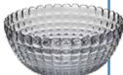
Ciotola 25 cm Prezzo € 13,50

La linea Tiffany comprende moltissimi prodotti: brocche, bicchieri, ciotole, coppette, vassoi e bowl... Una linea assolutamente completa!