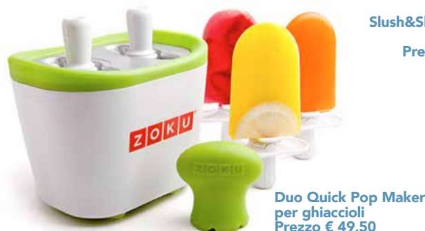
Duo Quick Pop Maker per ghiaccioli Prezzo € 49,50

La gamma di prodotti Zoku è molto ampia: facili da utilizzare e il risultato è assicurato! Ideali per le famiglie e le serate in compagnia, ma anche le feste, non solo dei bambini, o per le merende.